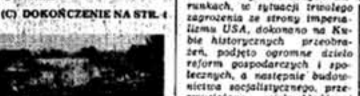
(P) Pogorzałisko w Dzierżkowicach.

Po dwuletnim pobycie w więzieniu zostaje zwolniony na mocy amnestii. Obowiązując się jedynie ponownego aresztowania, emigruje do USA i Meksyku, skąd — w listopadzie 1956 r. — powrócił potajemnie na Kubę, aby na czele 81-osobowej grupy dżentawierzy, reprezentującej organizację „Ruch 13 Lipca”, rozpocząć systematyczną walkę, której zwyciężskim akcentem będzie wywołanie wieloletniej armii powstania przeciw dyktaturze Batisty.