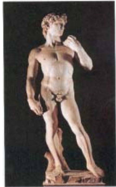
źródło: K. Zielińska, Z.T. Kozłowska, U źródeł współczesności. czasy nowożytne , Warszawa 1999.