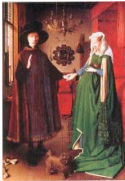
źródło: Wielcy malarze. Ich życie, inspiracje i dzieło. Jan Van Eyck , Nr 51, Warszawa 1999.