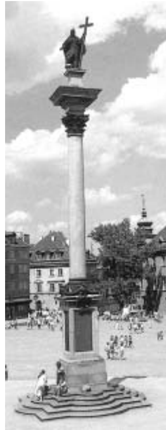
Kolumna Zygmunta III Wazy w Warszawie