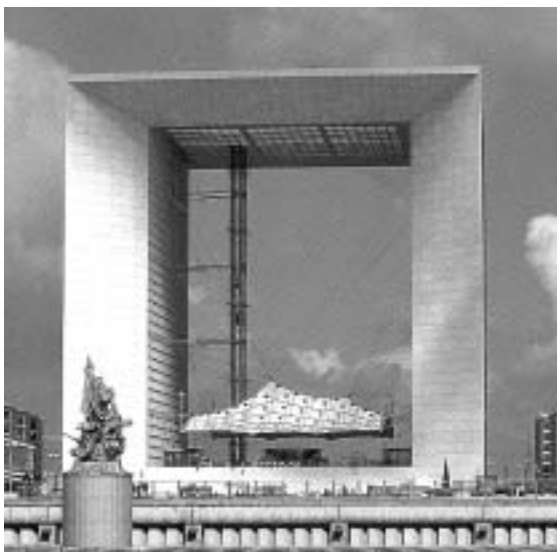
Wielki Łuk w dzielnicy La Defense w Paryżu