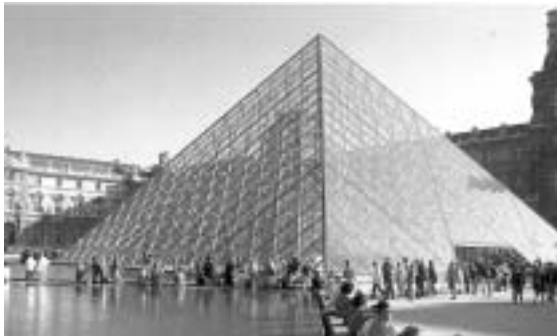
Piramida stojąca przed Luwrem w Paryżu