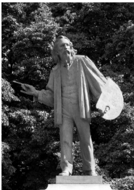
Pomnik Jana Matejki w Warszawie