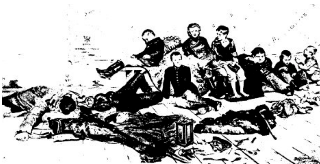
Jacek Malczewski, obraz pt. Zesłanie studentów